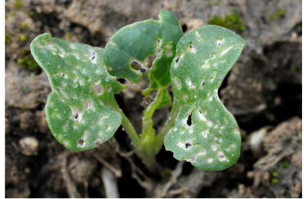
Plus de 25 % de la surface touchée