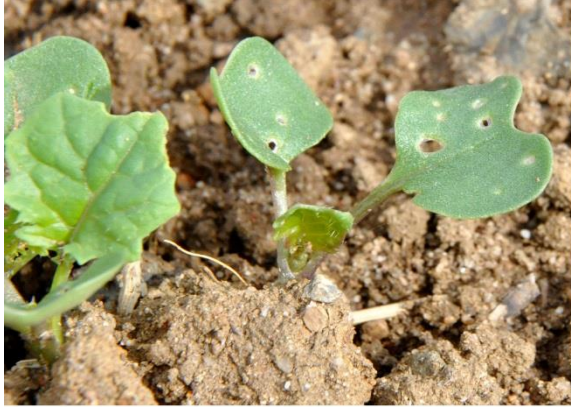
Moins de 25 % de la surface touchée

→ 8 pieds sur 10 portant des morsures. Il ne faut pas dépasser plus ¼ de la surface végétative détruite. Au-delà du nombre de plantes avec dégâts, il est important de déterminer la surface végétative endommagée. En cas de levée tardive (après le 1 er octobre), la vitesse de développement des colzas est ralentie et le seuil peut être abaissé à 3 plantes avec morsures sur 10.